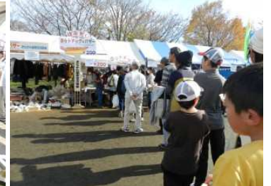
ホットドッグにできた長い列