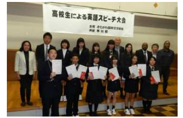
審査員の皆さんと記念写真

今回は、審査員も交流会に参加し、発表者との交流を楽しみました。 ここでの様子的一端をご覧ください。ご支援くださった皆様、ありがとうございました。