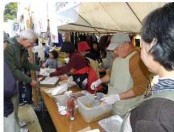
SIEA 特製ホットドッグとフリーマーケットでの販売開始