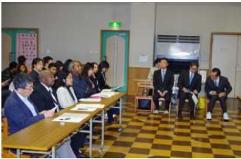
審査員と来賓の皆様