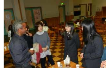
審査員も混じっての交流会